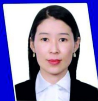
G'ULJAXAN BAYMUXANOVA "IBRAYIM YUSUPOV" ATINDAĞI MÁMLEKETLIK STIPENDIYA IYESI