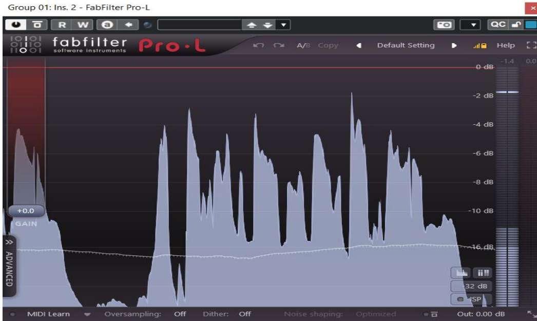
Rasm 3. FabFilter Pro-L interfeysi

Mastering jarayonida ushbu vosita platformalararo moslikni ta'minlaydi va dinamikani nazorat ostida saqlaydi.