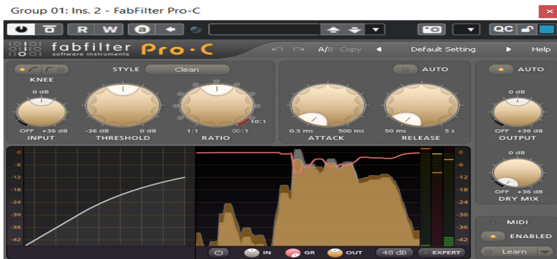
Rasm 2. FabFilter Pro-C interfeysi

Bu algoritmik moslashuv dinamikaning haddan tashqari yo‘qolib ketishini oldini olib, barqaror eshitish sifatini ta‘minlaydi. Ushbu plagindan ko‘pincha mastering paytida qo‘llaniladi.