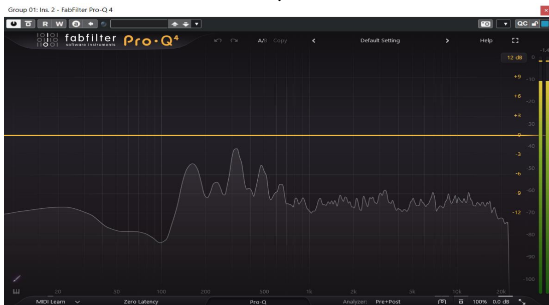
Rasm 1. FabFilter Pro-Q interfeysi

Faza-xavfsiz rejim mastering bosqichida muhim ahamiyatga ega bo‘lib, stereo sahnaning buzilishini oldini oladi. Natijada tovushning makon hissi va tiniqligi saqlanadi.