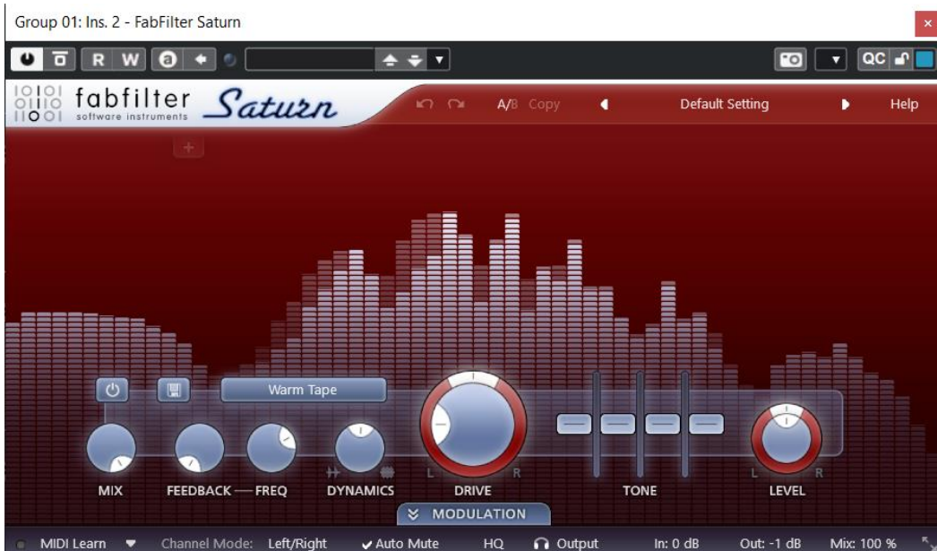
Rasm 4. FabFilter Saturn interfeysi

boyluk yaratadi. Nolinear modellar signalga yuqori tartibli garmonikalarning nazoratli qo'shilishini ta'minlab, analog qurilmalarga xos iliqlikni raqamli muhitda tiklaydi.