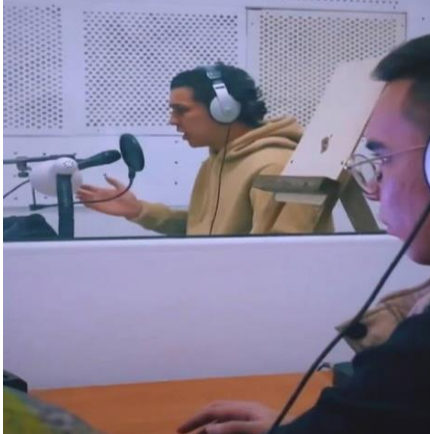
(1-rasm. "Shaʼnaraq" teleserialini ovozlashtirish jarayoni)

aktyorlarning emotsional holatini qayta tiklash, har bir soʻzning intonatsiyasini kadrğa mos ravishda sinxronlashtirish orqali qahramonlarning ichki dunyosi tomoshabinga yetkazib berildi.