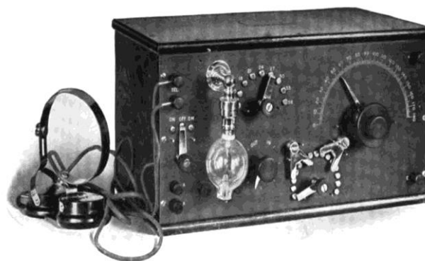
3. Li de Forest audioni